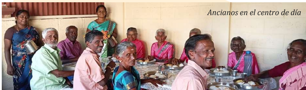
Ancianos en el centro de día

También hemos iniciado un programa de apadrinamiento / amadrinamiento para personas mayores, que acuden al centro de día de la localidad de Pattarvati. Acoge a diez ancianos que viven solos o su familia no puede atenderlos durante la jornada; en todo caso con muy pocos recursos. Reciben las tres comidas principales del día, cuidan del huerto y el jardín, y socializan entre ellos. Lo más importante: se sienten arropados, considerados y, cada uno a su modo, estimados. Está abierta la posibilidad de contribuir a este programa, según la disponibilidad de cada persona