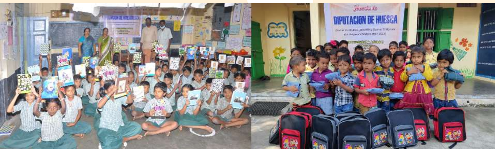
Entrega de material escolar

Mediamos ante la Diputación de Huesca, que aprobó nuestra propuesta de adquisición de equipamiento escolar básico para 50 niños de preescolar y primaria, dotada con 3.008,29 €. Este apoyo incentiva su escolarización, al aliviar gastos en familias cuyos ingresos apenas sobrepasan para la mera supervivencia.