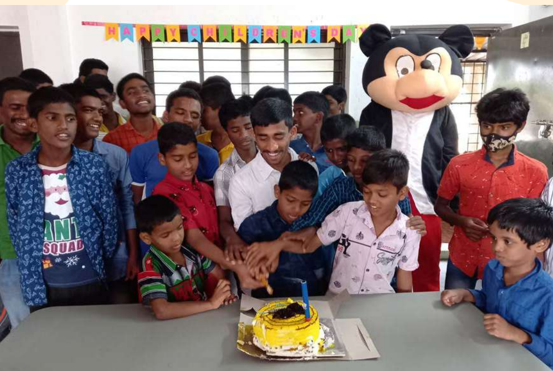
Celebración de cumpleaños en Shanti Nilayan

A menudo nos preguntáis por qué es un hogar de chicos y no mixto. El Gobierno indio obliga a que estos centros acojan sólo a menores del mismo sexo, por lo que cada organización gestora ha de optar por uno u otro.